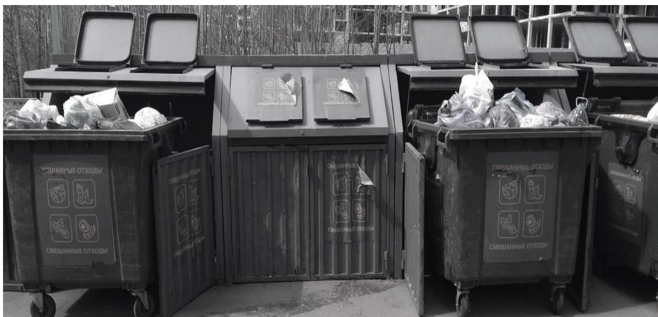
Рисунок 1. Емкости для сбора смешанных отходов (г. Москва, ТиНАО, п. Коммунарка)

Размещение возможно инфицированных средств защиты в емкости для смешанных отходов или для пластика является потенциально опасным для персонала при дальнейшей ручной сортировке.