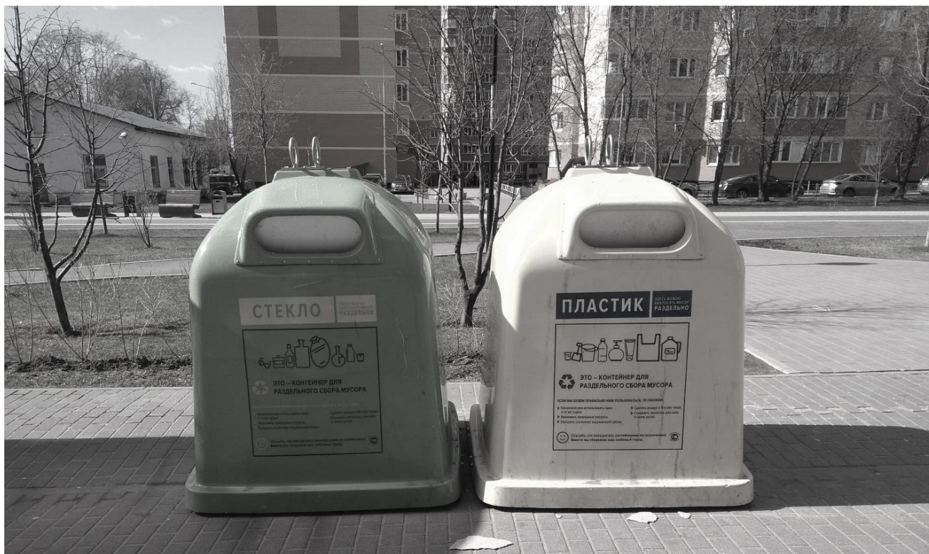
Рисунок 2. Баки типа «колокол» для сбора стекла и пластика (г. Москва, ТиНАО, п. Коммунарка)

Можно было бы предложить наладить «временный сбор» этих видов опасных отходов на базе аптек, поликлиник и/или лечебных учреждений, но в условиях пандемии – это невозможно и даже опасно, а для лечебных учреждений с позиции их территориального удаления и мало реалистично.