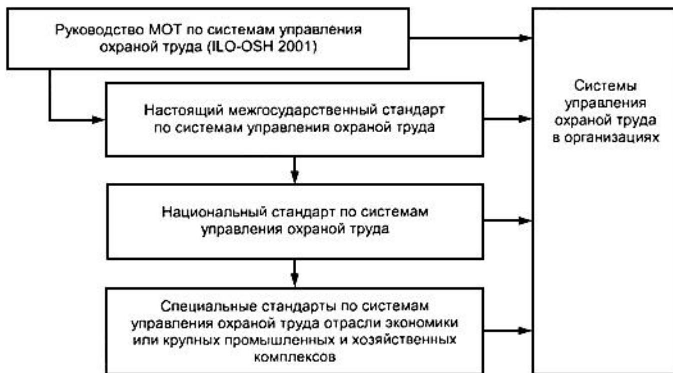
Рисунок 1 - Элементы национальных структур систем управления охраной труда